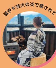
暖炉や焚火の炎で癒されて