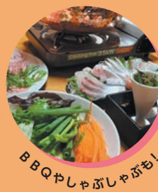
BBQやしゃぶしゃぶも！