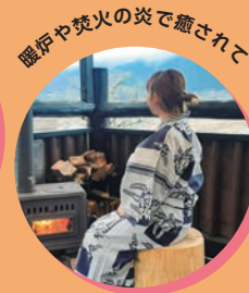
暖炉や焚火の炎で癒されて