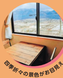
四季折々の景色がお目見え

1泊2食付プラン、素泊まり・朝食のみプランの他、10名様〜OK！気の合う仲間とワイワイ貸し切りプランもご用意。