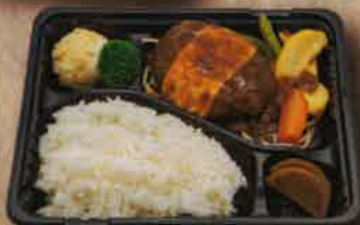
チーズデミソース