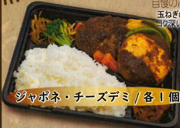
ジャポネ・チーズデミ / 各1個

自慢のふわふわジューシーハンバーグ！ 玉ねぎの甘みが特徴の自家製ジャポネソース コク深いチーズと王道デミソースどちらも相性抜群